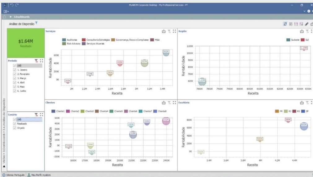
Dashboard: Análise de Dispersão