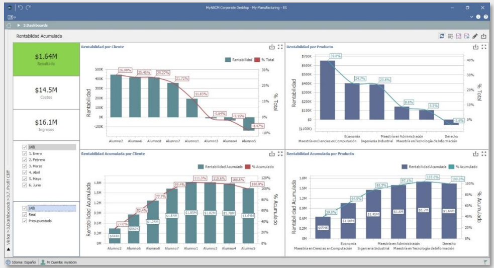
Gráfico de ballenas con rentabilidad acumulada por clientes, canales y productos